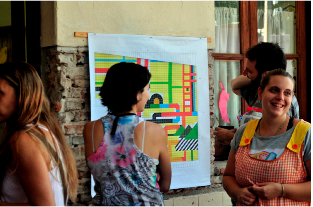
Diseño del patio del Jardín Público N67 en Rosario

zados desarrolla, junto a estudiantes, diseños para la plaza del lugar.